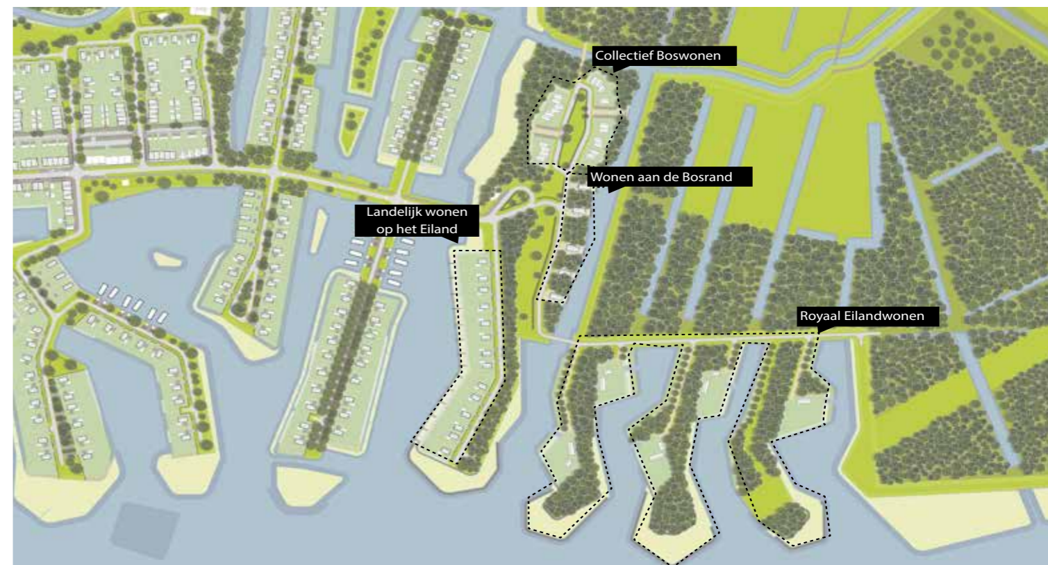
Indicatieve verkaveling woongebied Harksteder Broeklanden

Ondertussen zijn we ook al veel aan het doen. We focussen daarbij vooral op voorzieningen. We hebben de afgelopen jaren namelijk geleerd dat daar eerder aandacht voor nodig is. Zo zijn we nu bezig met twee nieuwe basisscholen, is er een groter gezondheidscentrum gebouwd en hebben we 900 nieuwe bomen geplant. Ook daarover leest u meer in deze editie. Net als over de procedures die nodig zijn om alles mogelijk te maken.