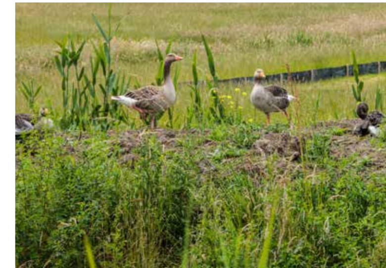
Kikkerscherm en ganzen in het gebied langs de Meerstadlaan

Op meerstad.eu/werkzaamheden vindt u alle actuele werkzaamheden.