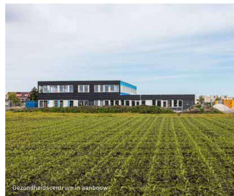
Gezondheidscentrum in aanbouw