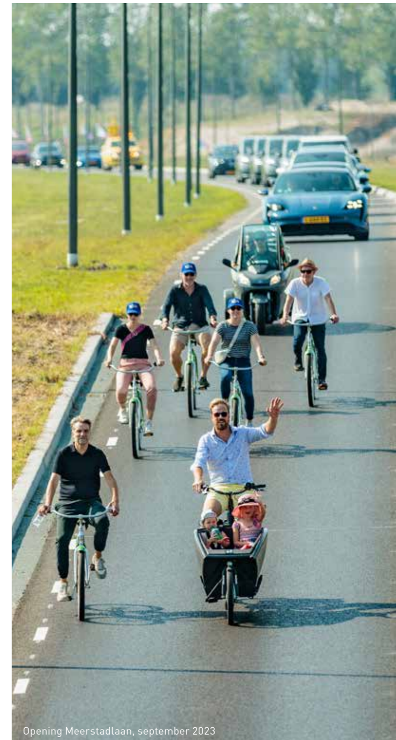
Opening Meerstadlaan, september 2023